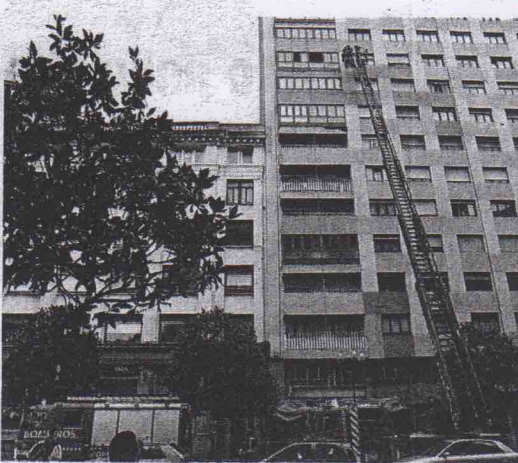
La grúa de los bomberos, desplegada.

Por su parte, el Colectivo de Trabajadores de Emulsa, denuncia "la deficiente publicidad y transparencia" en esta promoción interna. "La convocatoria establecía un plazo de sólo seis días en pleno mes de agosto, donde gran parte de la plantilla está de vacaciones o de descansos programados. El resultado es que sólo se han presentado 15 candidatos, de un total de 700 trabajadores".